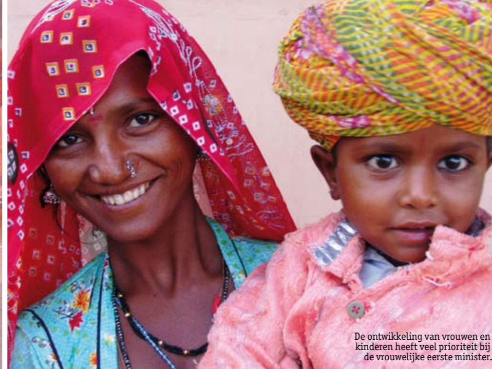
De ontwikkeling van vrouwen en kinderen heeft veel prioriteit bij de vrouwelijke eerste minister.