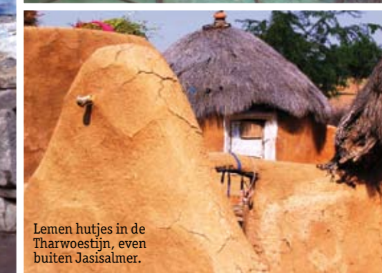
Lemen hutjes in de Tharwoestijn, even buiten Jaisalmer.