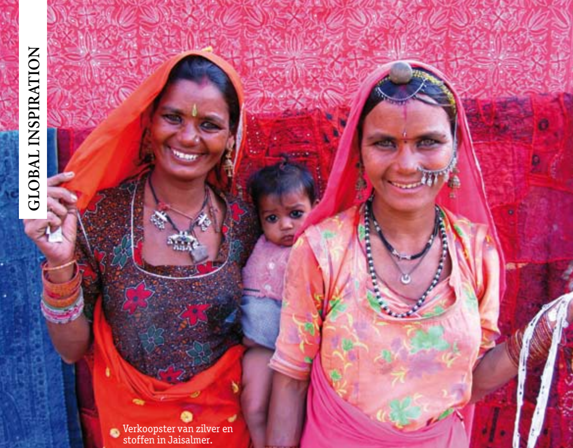
Verkoopster van zilver en stoffen in Jaisalmer.