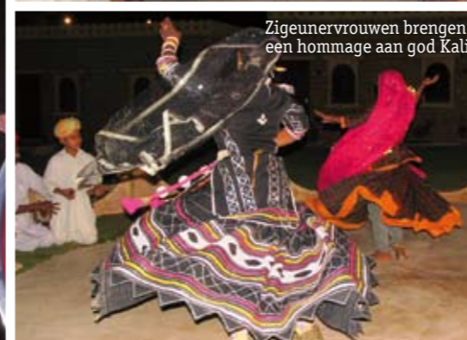
Zigeunervrouwen brengen een hommage aan god Kali.