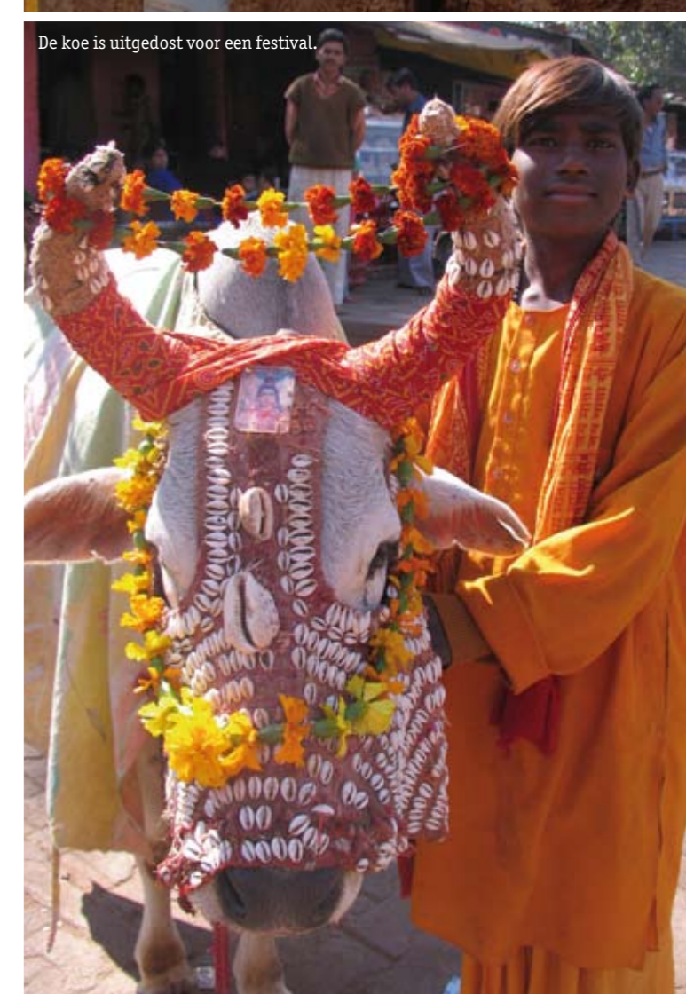
De koe is uitgedost voor een festival.