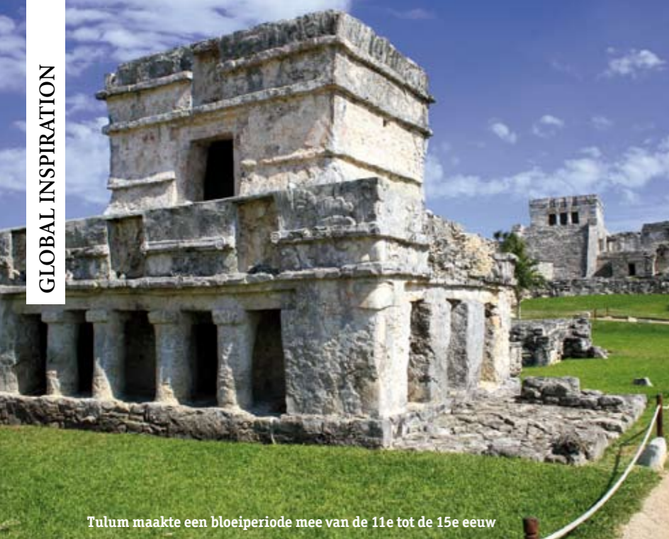
Tulum maakte een bloeiperiode mee van de 11e tot de 15e eeuw