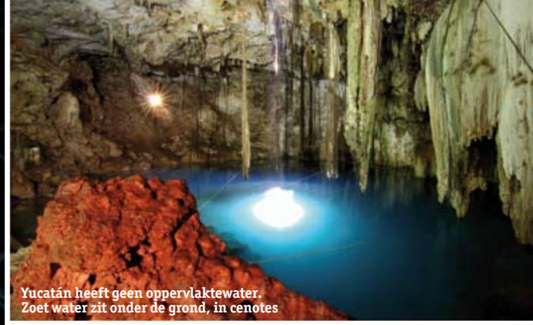
Yucatán heeft geen oppervlaktewater. Zoet water zit onder de grond, in cenotes