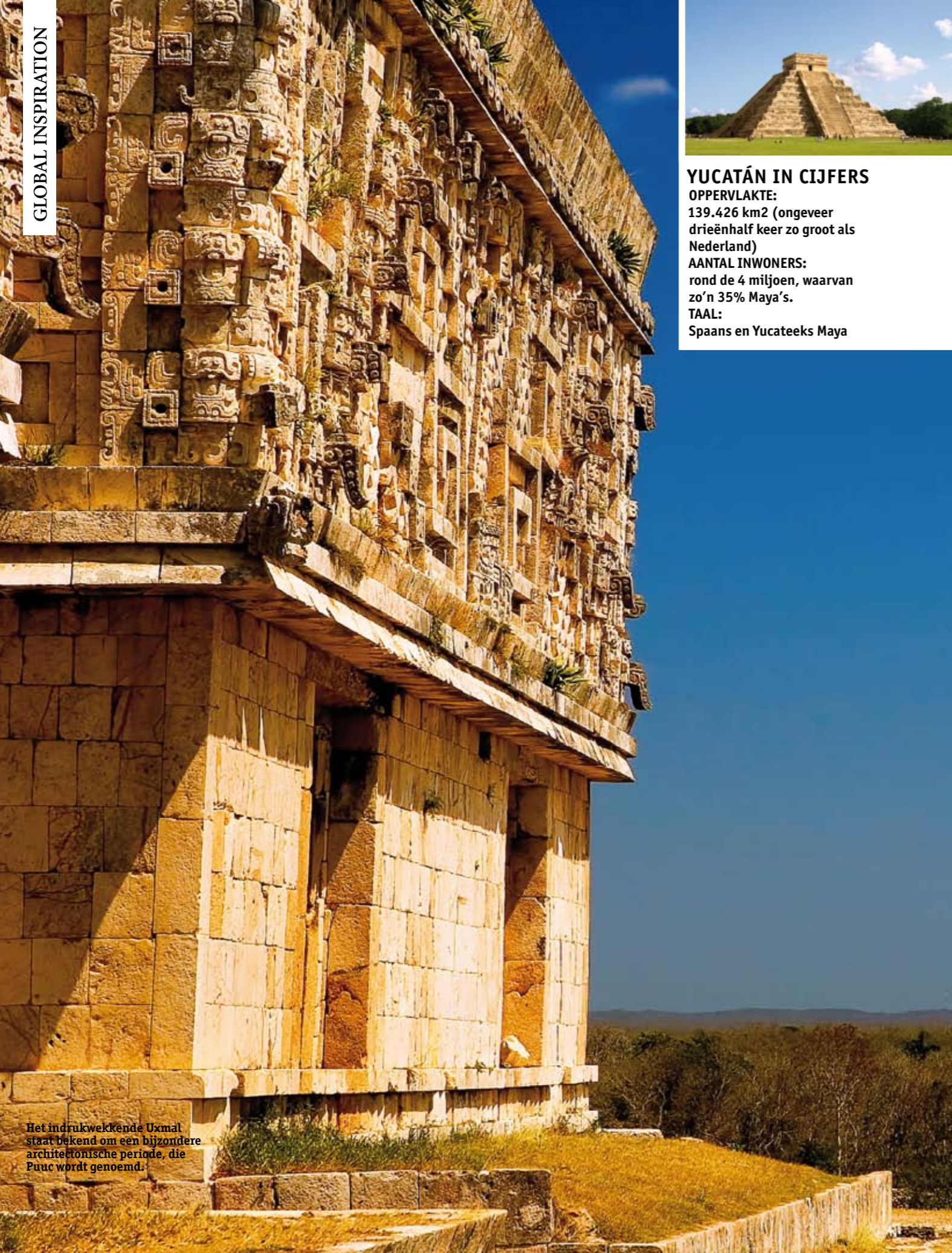
Het indrukwekkende Uxmal staat bekend om een bijzondere architectonische periode, die Puuc wordt genoemd.