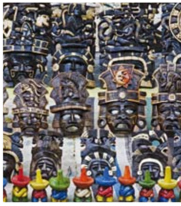
Playa del Carmen