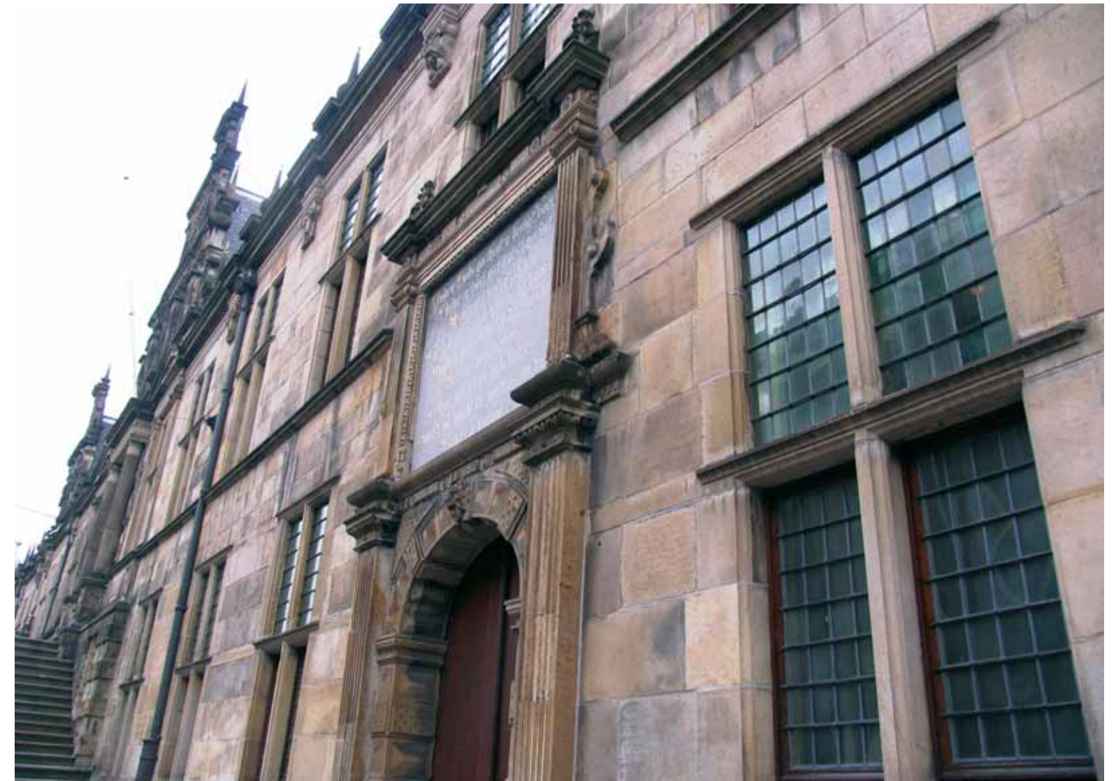
De voorgevel van het enorme Leidse Stadhuis heeft twee opvallende gevelstenen. In de linker is in drie verschillende lettertypen een vers van Jan van Hout te lezen (foto links). In het middelste deel tellen we 127 hoofdletters en twee lettertekens die samen het getal 129 vormen: ze staan symbool voor de 129 dagen die het tweede beleg van Leiden duurde. De goudgekleurde Romeinse cijfers geven opgeteld het jaartal aan: 1574. Op de rechtersteen staat in gotisch schrift nog een vers van dezelfde schrijver (foto boven).